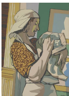
ALF ROLFSEN (1895-1979) Mor og barn (1941) Silketrykk, 52.6x37.9cm