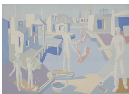
ARNE EKELAND (1908-1994) Komposisjon Silketrykk, 37.5x52.5cm