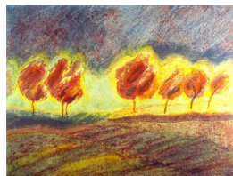
GRO FRAAS (F. 1944) Allé Litografi, 33x44cm