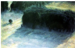
GRO FRAAS (F. 1944) Skygger Litografi, 50x77cm