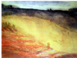
GRO FRAAS (F. 1944) Sensommer Litografi, 54.5x72cm