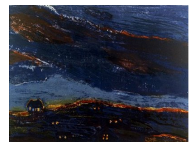
GRO FRAAS (F. 1944) Sommernatt Litografi, 32x41.5cm