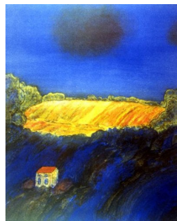
GRO FRAAS (F. 1944) Nocturne Litografi, 46.5x38.5cm