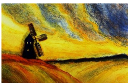
GRO FRAAS (F. 1944) Landmerke Litografi, 28x44cm