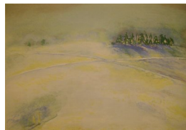
GRO FRAAS (F. 1944) Kryssende spor Litografi, 38x55cm