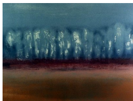
GRO FRAAS (F. 1944) Frost Litografi, 33x44cm