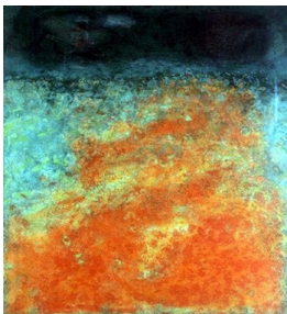
GRO FRAAS (F. 1944) Eng Litografi, 54x50cm