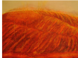
GRO FRAAS (F. 1944) Furer Litografi, 55x72cm