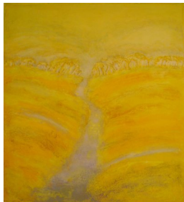
GRO FRAAS (F. 1944) Sommer Litografi, 56x51cm