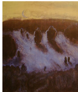
GRO FRAAS (F. 1944) Blå måne Litografi, 64x56cm