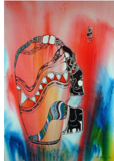
GRO HEINING (F. 1949) Krukken fra Santa Fe (1988) Blandet teknikk, 68x49cm