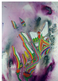
GRO HEINING (F. 1949) Regnbueblomst I (1988) Blandet teknikk, 73x52.5cm