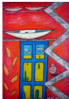
GRO HEINING (F. 1949) Vindusdrømmen (1994) Oljepastell, 70x50cm