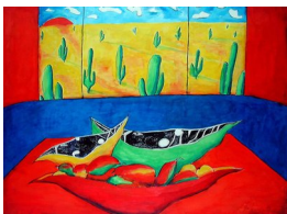
GRO HEINING (F. 1949) Kaktusmorgen (1995) Blandet teknikk, 56x76cm