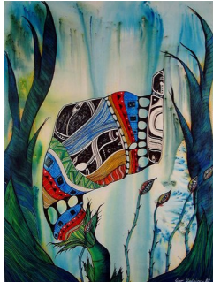
GRO HEINING (F. 1949) Regnbueblomst II (1988) Blandet teknikk, 57x42cm