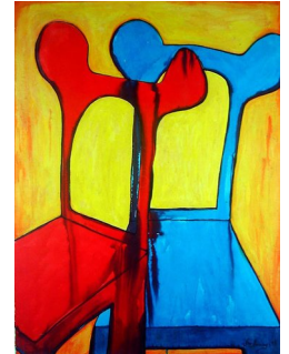
GRO HEINING (F. 1949) Stoler som drømmer (1993) Blandet teknikk, 76x57cm