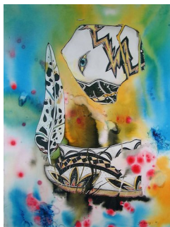
GRO HEINING (F. 1949) Meditasjon (1991) Blandet teknikk, 76x56.5cm