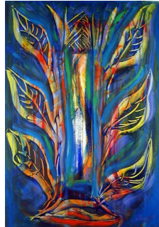
GRO HEINING (F. 1949) Ekvilibrium (1998) Akryl, 66x46cm