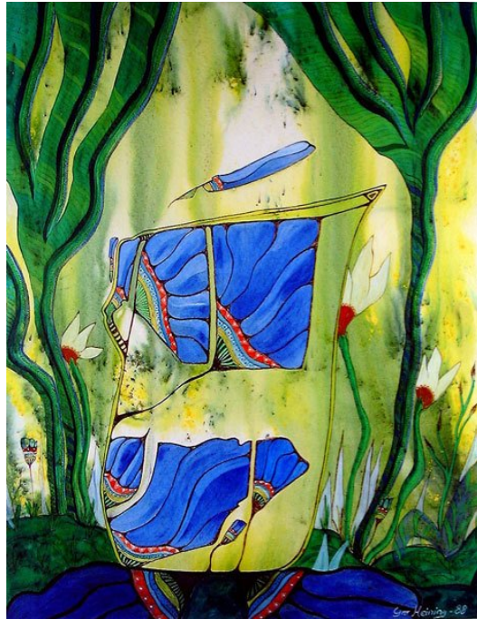
GRO HEINING (F. 1949) Blomster i soloppgang (1988) Blandet teknikk, 57x44,5cm