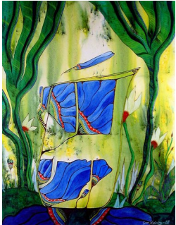
GRO HEINING (F. 1949) Blomster i soloppgang (1988) Blandet teknikk, 57x44.5cm

A 172 – Pasteller og blandingsteknikk, 11 verk