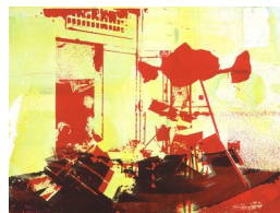
OLAV RINGDAL (F. 1961) Fødsel i kållåkeren (2003) Monotypi, 40x54cm