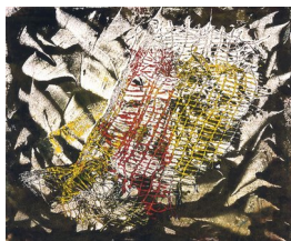
GUTTORM NORDØ (F. 1960) Uten tittel (2003) Monotypi, 21x25cm