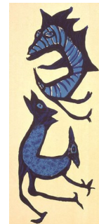
GUTTORM NORDØ (F. 1960) Hverken fugl eller fisk (2003) Litografi, 53.5x23.5cm