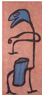
GUTTORM NORDØ (F. 1960) Trommis (2003) Litografi, 54x23.5cm