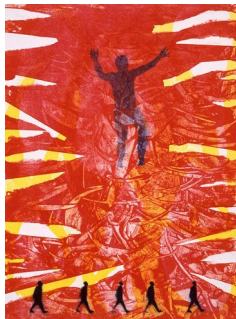
GUTTORM NORDØ (F. 1960) Uten tittel (2004) Litografi, 38.5x28cm