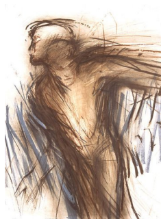
RUNI LANGUM (F. 1958) Mann Litografi, 76x56cm