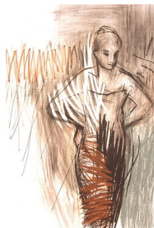
RUNI LANGUM (F. 1958) Honey Litografi, 71.5x48cm