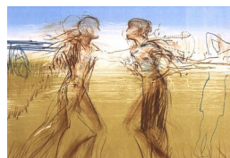
RUNI LANGUM (F. 1958) Om tid Litografi, 37.5x56cm