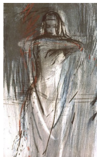
RUNI LANGUM (F. 1958) Save Litografi, 34.5x21.5cm