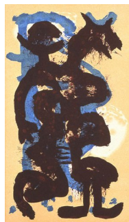
GUTTORM NORDØ (F. 1960) I løvens gap (2003) Litografi, 23.5x13.5cm