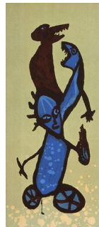
GUTTORM NORDØ (F. 1960) Let's make a night of it (2003) Litografi, 54x23.5cm