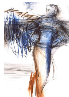
RUNI LANGUM (F. 1958) Fra Litografi, 75x53cm