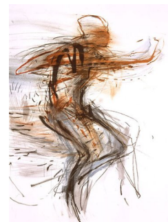
RUNI LANGUM (F. 1958) Vind (2004) Litografi, 55.5x41cm