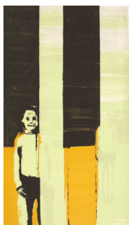
INGRID FORFANG (F. 1971) Happy to be Litografi, 40.5x23.5cm