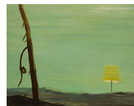
BENTE LOUISE AAS (F. 1958) Utelampe (2005) Olje på MDF, 25x32cm