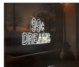
BEHZAD FARAZOLLAHI (F. 1978) 99 Cent Fotografi, 85.5x100cm