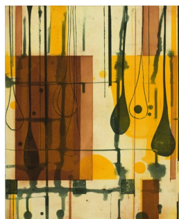
ASTRID SYLWAN (F. 1970) Crosscurrents VIII (2008) Litografi, 46x38cm