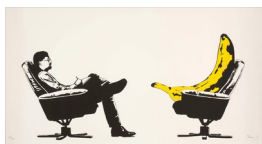
DOLK (F. 1979) Shrink (2009) Silketrykk, 50x90cm