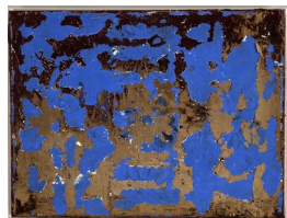
MONA LALIM (F. 1954) Connections (2009) Olje på lerret/plexi, 30x40cm