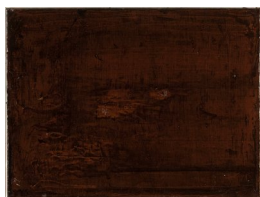
MONA LALIM (F. 1954) Connections (2009) Olje på lerret/plexi, 30x40cm