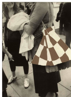
JACOB DAHLGREN (F. 1970) General Specific Work XVI Fotogravyr/etsning, 32x23.5cm