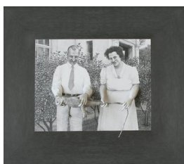
VANNA BOWLES (F. 1974) Behind the Hedge (2010) Blyant-tegning/pappmasje, 62x70cm