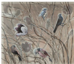
LISE SIMONNÆS (F. 1956) Gutten i skogen (del 2) (2009) Akryl på organza/plexi, 126x73cm