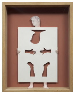
PETER CALLESEN (F. 1967) Paperman (2008) Papercuts/tegning, 47x37cm