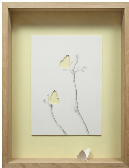
PETER CALLESEN (F. 1967) Two in one (2010) Papercuts/tegning, 47x37cm