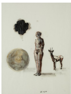
KJELL TORRISET (F. 1950) The Deer (2011) Tusj/shellac/kritt/olje på glassine papir, 49x37cm