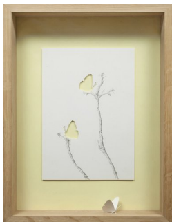
PETER CALLESEN (F. 1967) Two in one (2010) Papercuts/tegning, 47x37cm

A 209 – Fotografi, tekstil, tegning, 14 verk