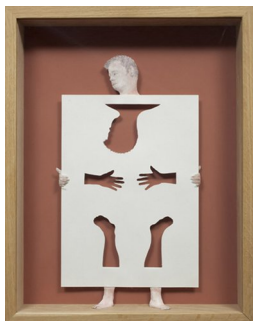
PETER CALLESEN (F. 1967) Paperman (2008) Papercuts/tegning, 47x37cm