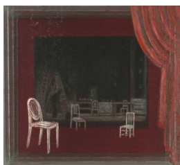
LISE SIMONNÆS (F. 1956) Scene I (2009) Akryl på silkeduk/plexi, 25x28cm