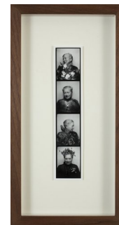
VANNA BOWLES (F. 1974) Uten tittel (2010) Fotocollage, 30.5x14cm