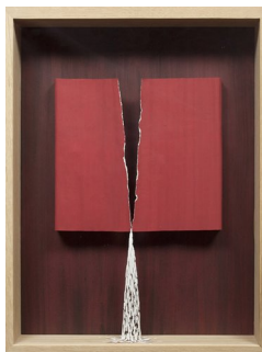
PETER CALLESEN (F. 1967) The Curtain (2009) Papercuts/tegning, 46x36cm