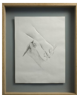
PETER CALLESEN (F. 1967) Selfmade Escher (2008) Papercuts/tegning, 67x55cm