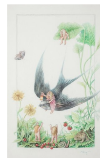
SVERRE MALLING (F. 1977) Uten tittel (2012) Tegning, 33x20cm