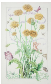
SVERRE MALLING (F. 1977) Uten tittel (2012) Tegning, 33x20cm