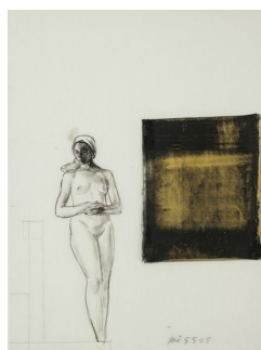
KJELL TORRISET (F. 1950) Gullgrunn (2011) Tusj/shellac/kritt, 49x37cm