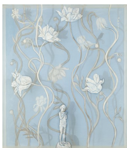
LISE SIMONNÆS (F. 1956) Undring (2008) Akryl på silkeduk/plexi, 75x65cm