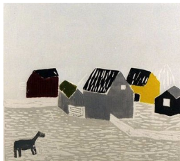
HANNE BORCHGREVINK (F. 1951) Dyret (1989) Tresnitt, 30x33cm