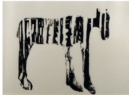
TORE HANSEN (F. 1949) Å møte et dyr (1988) Tresnitt, 25x25cm