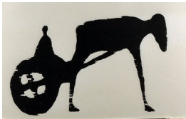
TORE HANSEN (F. 1949) Solvogn (1989) Tresnitt, 24x36cm