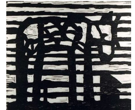
TORE HANSEN (F. 1949) Det ensomme dyr (1990) Tresnitt, 42x48cm