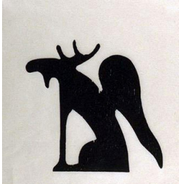
TORE HANSEN (F. 1949) Elg (1991) Tresnitt, 30x25cm