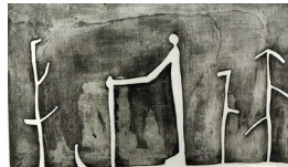
TORE HANSEN (F. 1949) Figurer i landskap (1987) Tresnitt, 30x50cm