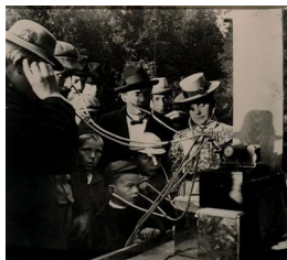
Phonograf vist frem under et dyrskue i Snåsa Fotografi, 27.5x30.5cm