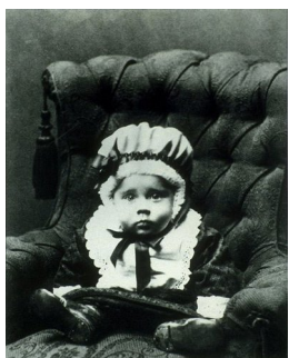
UKJENT FOTOGRAF Den må tidlig krøkes som... Fotografi, 49.5x40cm