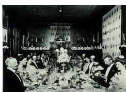
ANDERS BEER WILSE (1865-1949) Festmiddag (1904) F, 22x29.5cm