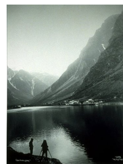
ANDERS BEER WILSE (1865-1949) Fotografen i aksjon (1908) Fotografi, 82x61cm