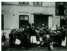
ANDERS BEER WILSE (1865-1949) Kø utenfor matutsalget (1913) F, 23x29.5cm