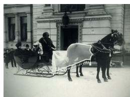
ANDERS BEER WILSE (1865-1949) På kjøretøyet skal storfolk kjennes F, 37x49cm