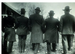
Skyttere ved skytterhuset på Skui i Bærum