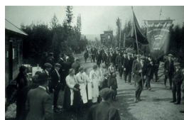
UKJENT FOTOGRAF Og så samles vi på valen Fotografi, 54x83cm