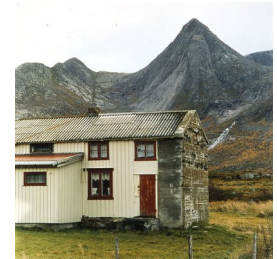
RUNE JOHANSEN (F. 1957) En fjellvegg og en husvegg (2005) Fotografi, 93.5x90cm