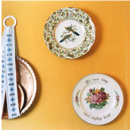
RUNE JOHANSEN (F. 1957) Gi oss i dag vårt daglige brød (2005) Fotografi, 93.5x90cm