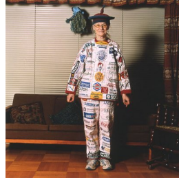
RUNE JOHANSEN (F. 1957) Shirley (2005) Fotografi, 93.5x90cm