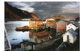
INGHILD KARLSEN (F. 1952) White trash (Nyksund) (1992) Fotografi, 59.5x89.5cm