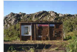
INGHILD KARLSEN (F. 1952) Gringo bar (1996) Fotografi, 59.5x90cm