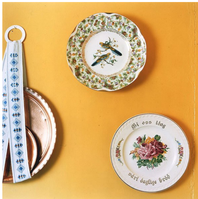
RUNE JOHANSEN (F. 1957) Gi oss i dag vårt daglige brød (2005) Fotografi, 93.5x90cm