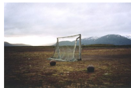
INGHILD KARLSEN (F. 1952) Øst-Vest-hjemme best (1992) Fotografi, 59.5x90cm