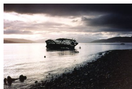
INGHILD KARLSEN (F. 1952) White trash (båt utfor Tromsø) (1995) Fotografi, 60x90cm