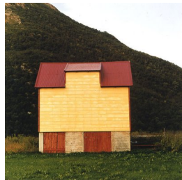
RUNE JOHANSEN (F. 1957) Et hus? (2005) Fotografi, 93.5x90cm