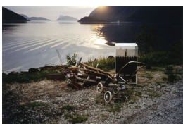
INGHILD KARLSEN (F. 1952) White trash (Kvaløya) (1995) Fotografi, 59.5x89.5cm