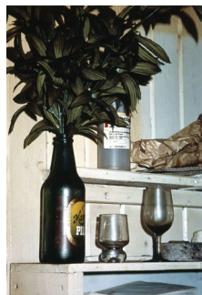
INGHILD KARLSEN (F. 1952) Kaptein Hvile (1989) Fotografi, 67x47cm