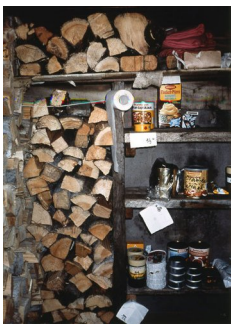
INGHILD KARLSEN (F. 1952) Kaptein Hvile (1989) Fotografi, 67x47cm