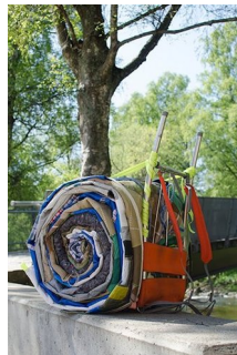
LINE SOLBERG DOLMEN (F. 1982) Vi bygger og utvikler fremtidens sanfunn III (2016) Fotografi, 79x52cm