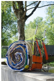
LINE SOLBERG DOLMEN (F. 1982) Vi bygger og utvikler fremtidens sanfunn III (2016) Fotografi, 79x52cm