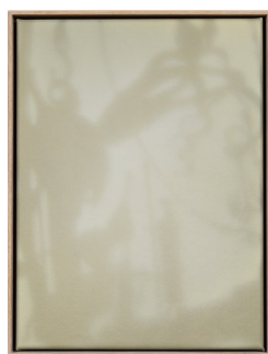
LARS MORELL (F. 1980) Shadow Canvas (2018) Akryl på lerret, 42x32cm