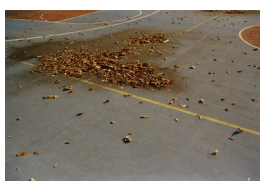
KRISTIAN SKYLSTAD (F. 1982) Court of leaves (2014) Giclée print på Canson Platine 310g/m, 24x36cm