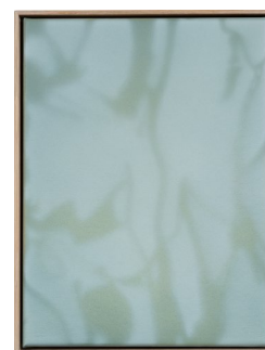
LARS MORELL (F. 1980) Shadow Canvas (2018) Akryl på lerret, 42x32cm