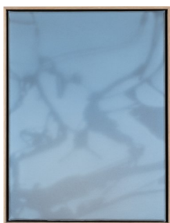
LARS MORELL (F. 1980) Shadow Canvas (2018) Akryl på lerret, 42x32cm