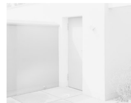
ESPEN GLEDITSCH (F. 1983) Weissenhofsiedlung 4, House 14-15, Le Corbusier & Pierre Jeanneret (2017) Inkjet print på aluminium, 50x40cm