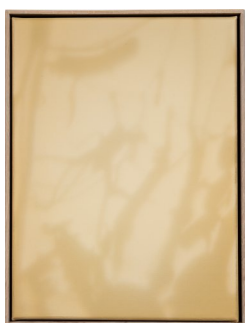
LARS MORELL (F. 1980) Shadow Canvas (2018) Akryl på lerret, 42x32cm