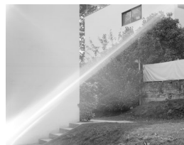
ESPEN GLEDITSCH (F. 1983) Weissenhofsiedlung 2, House 14-15, Le Corbusier & Pierre Jeanneret (2017) Inkjet print på aluminium, 50x40cm