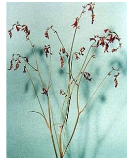
LINE WÆLGAARD (F. 1959) Uten tittel (1994) Fotografi, 24.5x19.5cm