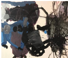
PETER SKOVGAARD (F. 1960) Skovens dualisme (2019) Olje på lerret, 105x125cm