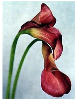
LINE WÆLGAARD (F. 1959) Uten tittel (1994) Fotografi, 24.5x19.5cm