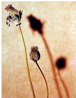
LINE WÆLGAARD (F. 1959) Uten tittel (1994) Fotografi, 24.5x19.5cm