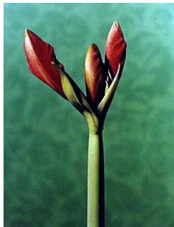
LINE WÆLGAARD (F. 1959) Uten tittel (1994) Fotografi, 24.5x19.5cm