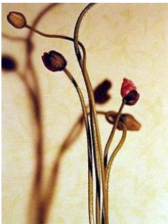
LINE WÆLGAARD (F. 1959) Uten tittel (1994) Fotografi, 24.5x19.5cm