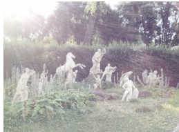
ELINE MUGAAS (F. 1969) Garden (2017) Fotografi, 51x65.5cm