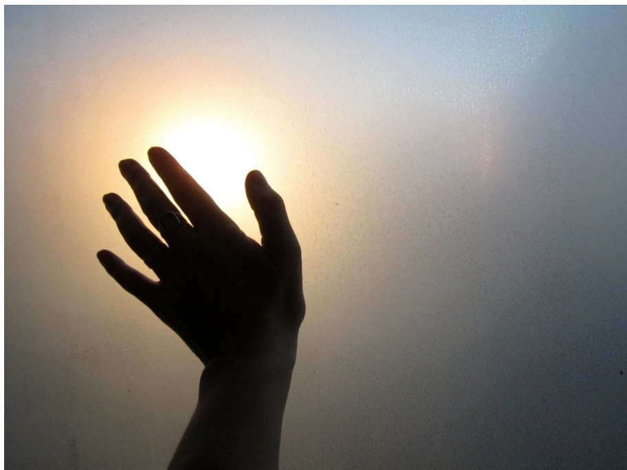
ELINE MUGAAS (F. 1969) Touching the Setting Sun (2014) Fotografi, 111x149cm