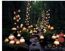
RUNE GUNERIUSSEN (F. 1977) Ravnen skriker over lavlandet (2013) Fotografi, 100x128cm