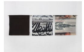
MARIA BRINCH (F. 1984) The Midnight Lunch Break I (2014) Ull, printet og malt, 100x340cm