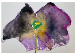
ELISABETH HAARR (F.1945) Poppy #9 (2022) Akvarell på papir, 21x30cm