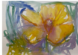
ELISABETH HAARR (F.1945) Poppy #3 (2022) Akvarell på papir, 21x30cm