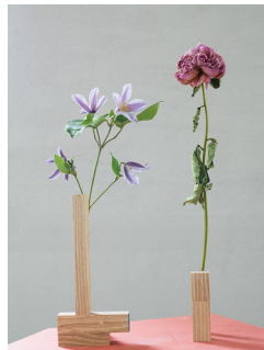
MARTHE ELISE STRAMRUD (F.1984) Disse blomstene visner aldri (2017) Fotografi, 60x45cm