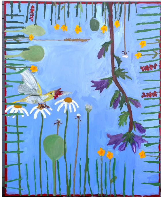
LIV ERTZEID (F.1986) The Ballerina (2023) Maleri, 180x145cm