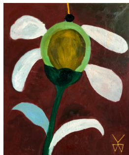
MARTHE KAMPEN (F.1986) Dagbok (2021) Olje på lerret, 120x100cm