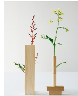
MARTHE ELISE STRAMRUD (F.1984) Disse blomstene visner aldri (2017) Fotografi, 60x45cm