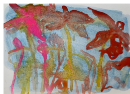
ELISABETH HAARR (F.1945) Poppy #11 (2022) Akvarell på papir, 21x30cm