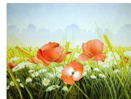
JAN HARR (F.1945) Markens grøde Litografi, 30x40cm