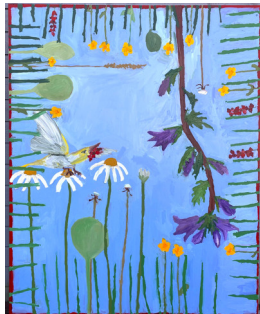
LIV ERTZEID (F.1986) The Ballerina (2023) Maleri, 180x145cm