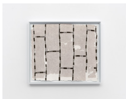
MARTIN SÆTHER (F.1986) #8 (2023) Collage på håndlaget papir , 32x37cm