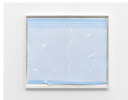
MARTIN SÆTHER (F.1986) #4 (2023) Collage på håndlaget papir , 37x42cm