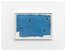
MARTIN SÆTHER (F.1986) #1 (2023) Collage på håndlaget papir , 26x37cm

A 238 – Maleri, collage på håndlaget papir, 10 verk