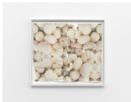
MARTIN SÆTHER (F.1986) #3 (2023) Collage på håndlaget papir , 33x36cm