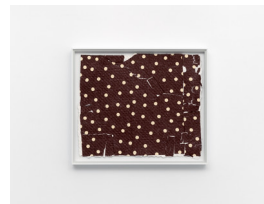
MARTIN SÆTHER (F.1986) #5 (2023) Collage på håndlaget papir , 34x29cm