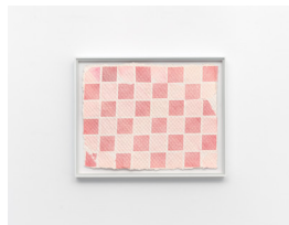
MARTIN SÆTHER (F.1986) #2 (2023) Collage på håndlaget papir , 27x33cm