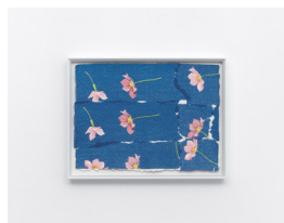
MARTIN SÆTHER (F.1986) #7 (2023) Collage på håndlaget papir , 28x36cm