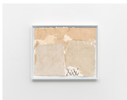
MARTIN SÆTHER (F.1986) #6 (2023) Collage på håndlaget papir , 27x34cm