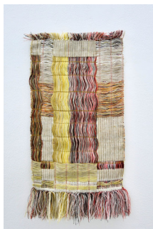
SIRI PETERSSON (F. 1990) Trion I (2025) Tekstil, 78x40cm