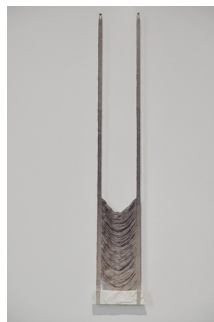
TOVE STARFELT (F. 1993) Hold and brace I (2026) Marmor og tekstil, 145x28cm