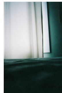
SIGNE FUGLESTEG LUKSENGARD (F. 1990) Diafragma 15 (2025) Fotografi, 53x80cm